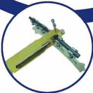
Sistema de Fijadores Externos ESF