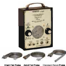
Infant Flat Probe Adult Flat Probe Standard Petal Probe