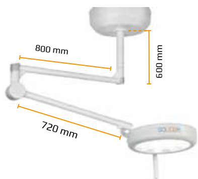
Soporte de techo (En configuración individual o doble)

SOLED15 está disponible en las siguientes versiones