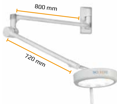
Soporte de pared